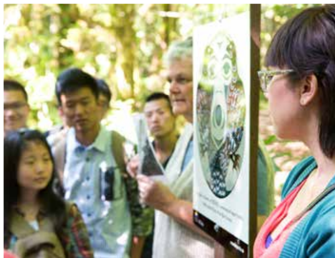
Students from the Yanqing Institute of Technology in Beijing visit the Tsartlip Nation at Tod Inlet to take part in an environmental education and restoration project. 来自北京燕京职业学院的学生们通过参观 Tod Inlet 的原住民地区,参与到环境教育及恢复的项目中。